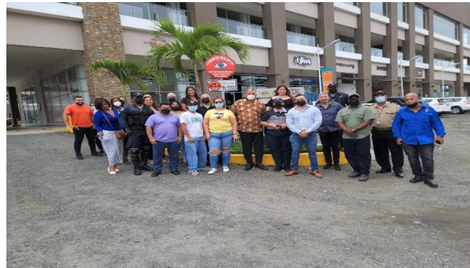
19ª Zona de Policía de Chame