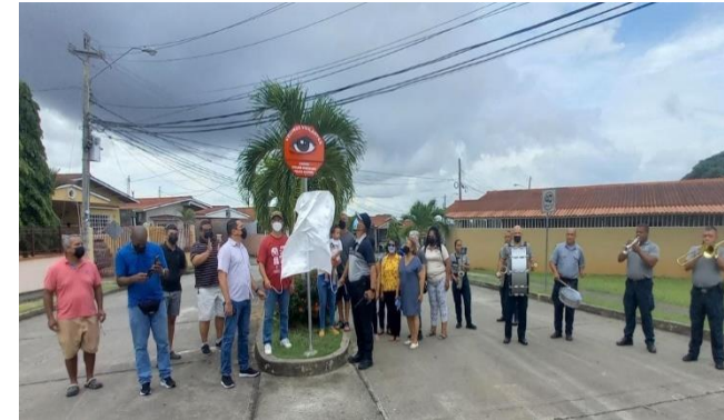
21ª Zona de Policía de San Francisco